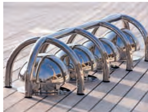
boven: Een eindeloos dek zonder veel obstakels. De centrale kuip is bestemd voor gasten aan boord

Eigenaren van superjachten zijn meestal individualisten die zakelijk succes geboekt hebben door anders te denken en anders te werken. Hun uitgesproken mening kan soms een probleem geven wanneer het ontwerp bureau, de interieurontwerpers en de werf de grenzen van wat werkbaar is in het oog moeten houden en hun eigen belangen verdedigen. Maar soms levert het echter een win-win situatie op, zodat het resultaat het basisontwerp, dat ooit met wat tweedimensionale lijntjes op papier begon, overstijgt en tot iets bijzonders maakt. De grenzen van de superjachtbouw worden dan weer een stukje verlegd en er ontstaat een nieuwe norm. Zo’n schip is de Atalante , in ieder geval tot het volgende