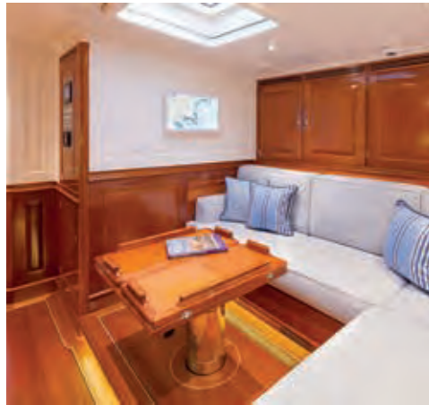
boven: De gezellige bar in het achterschip, direct onder de centrale kuip gelegen. Het zal er goed toeven zijn na een wedstrijd